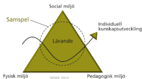
Figur 1 Samspelet i tillgänglighetsmodellen (Tufvesson, 2014)